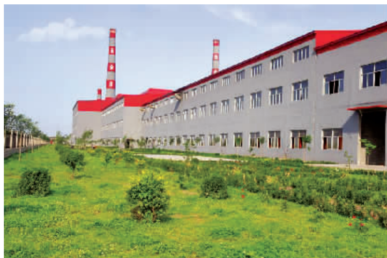
安全实业集团浮法玻璃生产线厂区

余人。公司拥有浮法玻璃生产线 3 条、格法玻璃生产线 6 条以及压延玻璃生产线 2 条,年产玻璃 1200 万重量箱。能为用户提供优质深加工平板和门窗玻璃。该公司坚持节能、低耗、环保、循环经济发展方向,正在建设自洁净、低辐射镀膜、中空等节能玻璃生产线以及余热发电站。