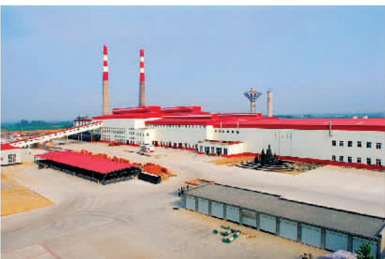
长城玻璃有限公司浮法生产线厂区