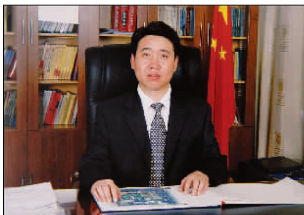
沙河市人民政府市长 曲斌

技、人才、创新、品牌”的经济发展战略,积极培育新型产业,目前已形成了采矿、新型建材、冶金机械制造、医药化工、纺织服装、食品和农副产品深加工六大支柱产业。全市生产总值、财政收入连年大幅增长,综合经济实力多年位居河北省前 30 强县(市)之列,在邢台